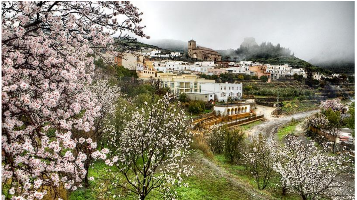
La comarca de Filabres-Alhamilla, en Almería, tife de blanco, rosa o amarillo sus almendros cuando llega esta época del año.

Las diez ciudades con el mejor arte urbano