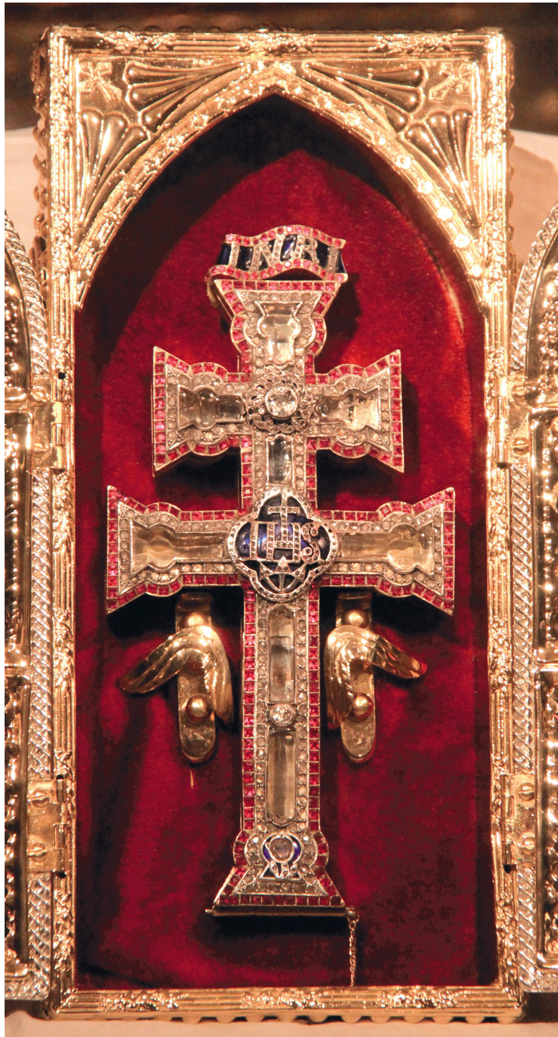
Bei Pilgern begehrt: Das Reliquien-Kreuz von Caravaca de la Cruz.

Wie der erste Holzsplitter im 13. Jahrhundert nach Caravaca kam, ist nicht ganz klar. Eine irdische Version besagt, der damalige