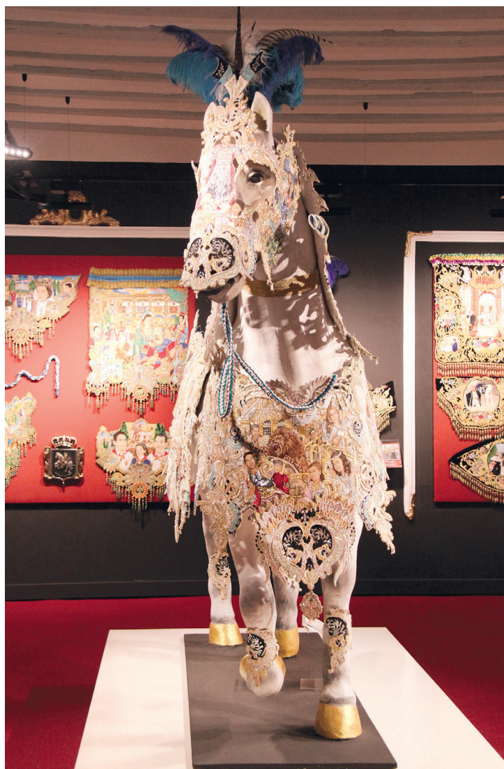
Ein Museum für Caravacas berühmtes Weinperde-Fest.

Bis vor kurzem zeigten die Ordensschwwestern ihren heiligen Schatz nur ein einziges Mal im Jahr. Doch mit dem Heiligen Jahr konnte man die Nonnen überzeugen, die Reliquien permanent für die Caravaca-Pilger auszustellen. Wer weiß – vielleicht darf sich ja auch Mula schon bald in die Liste der Heiligen Stätten einreihen.