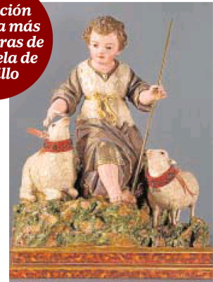
«Niño Pastor» De Marcos Laborda

Una exposición muestra más de 50 obras de la escuela de Salzillo