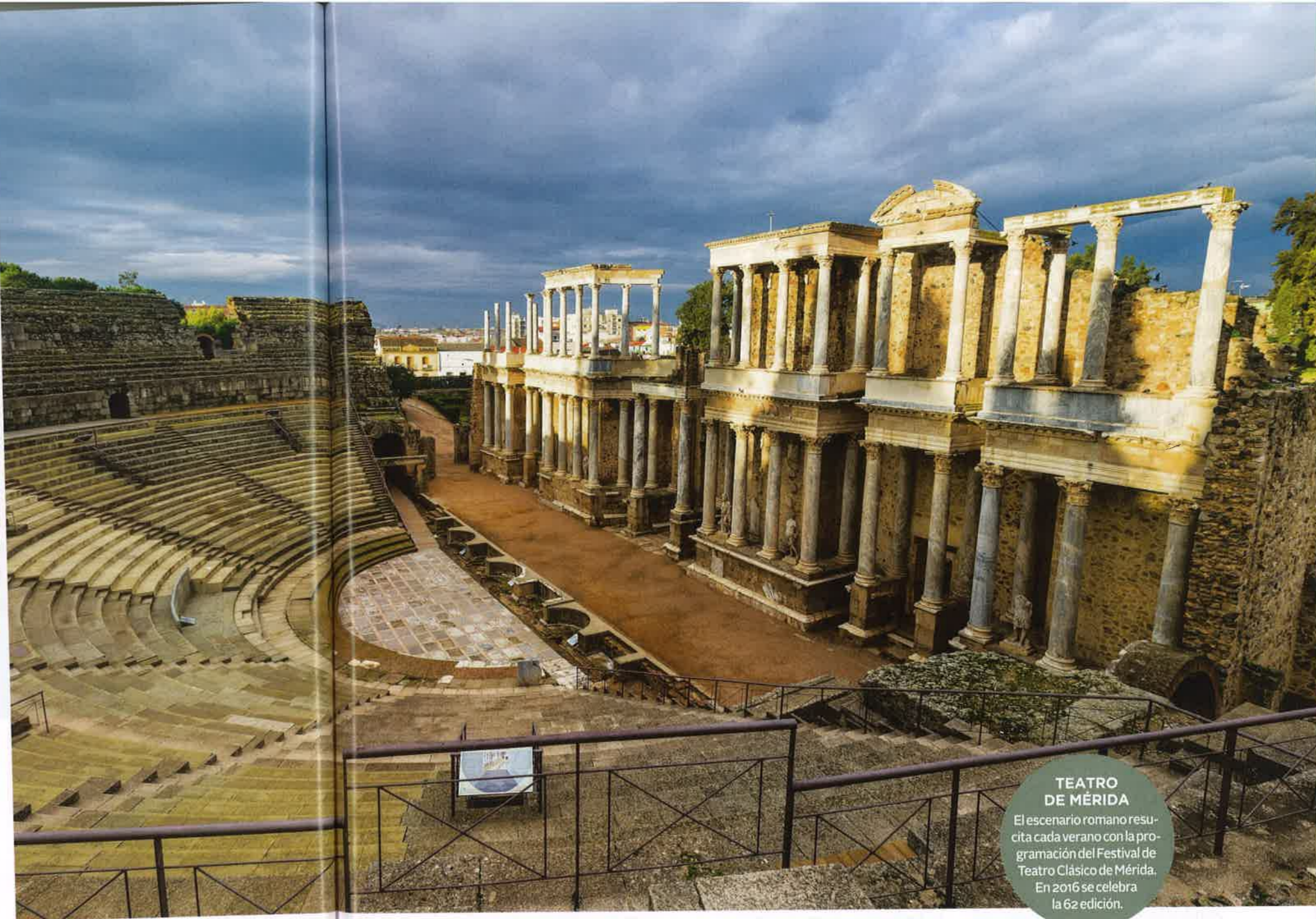
TEATRO DE MÉRIDA

5 Murallas de Lugo. El robusto cinturón que rodea el centro histórico de Lugo es el principal testigo de la ciudad romana de Lucus Augusti. La muralla, iniciada en el siglo III, tiene una longitud de 2.266 m y conserva muros de hasta 7 m de ancho, 85 torreones y 10 puertas. Patrimonio de la Humanidad, el sólido muro está coronado por un paseo de adarve que permite disfrutar de las vistas e imaginar el poderío que ostentó Roma. www.lugoturistico.com